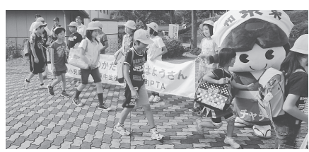
茶茶ちゃんも一緒に「おはようございます。」

毎週水曜日の朝は、小学校下ロータリーで、「あいさつは元気のかたまり おはようさん」を合言葉に、小学校の児童会が中心となって行っているあいさつ運動そのあいさつ運動をさらに盛り