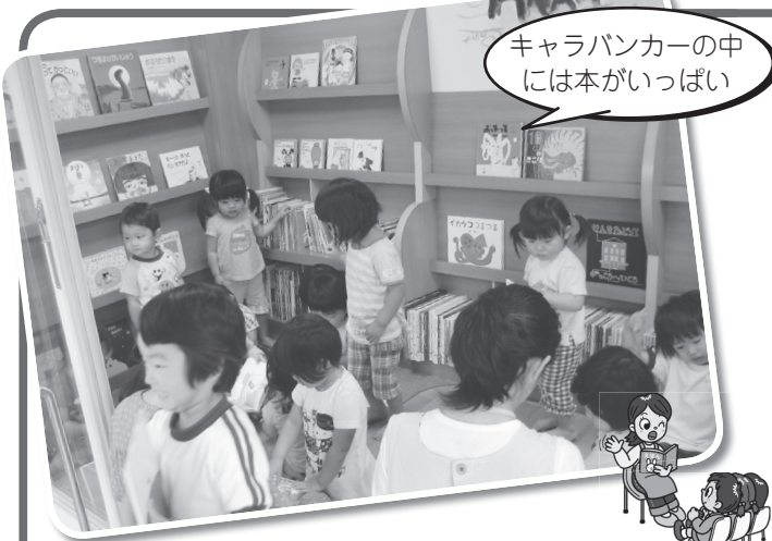
キャラバンカーの中には本がいっぱい

キャラバンカーには絵本が五五〇冊積んであり、訪問先では、紙芝居や絵本の読み聞かせ、キャラバンカーに積載した絵本を自由に手にとることが出来ます。