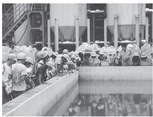
熱心に説明を聞く児童たち

児童らは、この日の水道施設の見学を通して、水道施設がライフラインといわれる最も重要な施設であることと水の大切さを実感しているようでした。