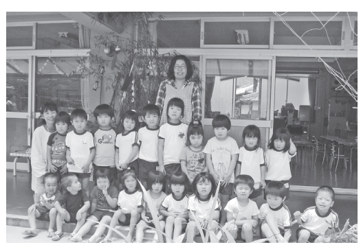
短冊に願いをこめて

集いでは、全員で七夕の歌を歌ったり、ペープサート「織姫と彦星」を觀賞しました。お話しでは、織姫と彦星が一年に一度しか会うことができないうので、七月七日の晴れた星空に、二人がうまく出会えるかどうか、園児たちは、はらはらどきどきして觀賞していました。