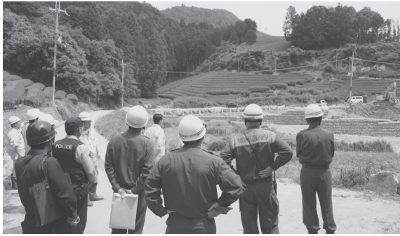
災害復旧現場の視察の様子

パトロールには、山城広域振興局副局長をはじめ、山城南土木事務所長、河川砂防室長、町議会議員、木津警察署員、