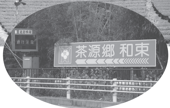
大きな看板で出迎える（木津川市井平尾）

商標登録「茶源郷和束」が観光ツアーや農業体験イベント、茶を中心とする飲食物の名前などに地元で積極的に活用されることはもとより、さらに林業、福祉、教育、観光、商工等幅広く活用されることを期待します。