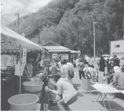
八重桜もちラホラ

当日は、新鮮な農産物の販売はもちろんのこと、「杵つきもち」の無料サービス、「焼きしいたけ」「しいたま焼き」の販売などが行われ、訪れた多くの人たちでにぎわっていました。