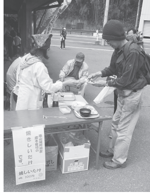
好評！焼きしいたけ