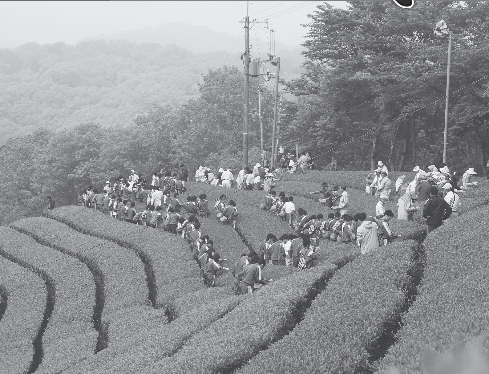
南山城村田山地区(辻本茶園)

本年、南山城村では、「京都府茶品評会」「関西茶品評会」「全国茶品評会」に向けて、農林水産大臣賞を目指し、煎茶の出品茶製造に汗を流しました。最初に行われる京都府茶品評会の審査は、7月3日から4日の2日間、宇治茶会館で開催され、お茶の外観、香気、水色、滋味の審査により、それぞれの合計点で競われます。今年は村内から15点のお茶が出品されることになっており、大きな期待が寄せられています。