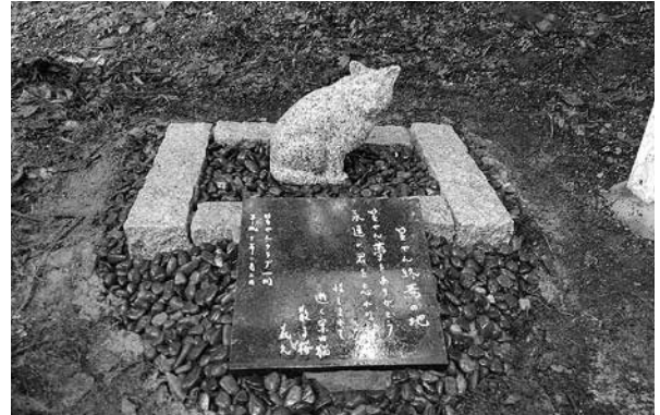
寄贈された笠やんの石碑

多くの人に愛された「笠やん」がみなさんの心に残り、案内猫・笠やん伝説として永遠に語り継がれていく事でしょう。