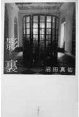
影裏 沼田真佑 著