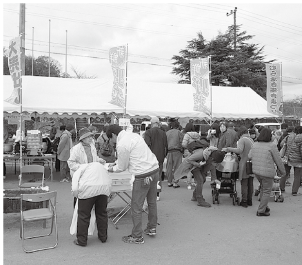
昨年の会場の様子

※村内の方については、巡回バスを運行しますので、各戸配布のチラシをご覧ください。