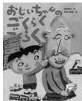
おじいちゃんのおひるごはん 西本鶏介作・長谷川義史 絵