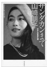
サンドカンまでわたしの生きた道 山崎朋子 著