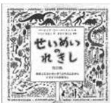
せいめいのれきし パシニア・リー・バートン 著