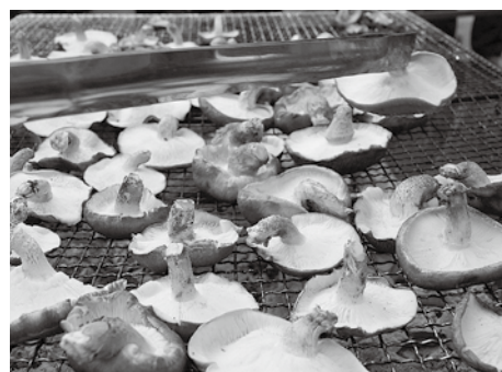
原木しいたけの炭火焼き