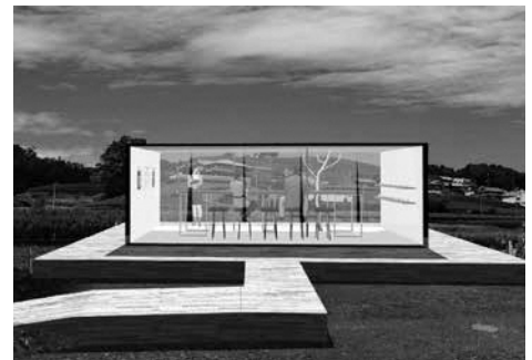
茶畑ハウス(イメージ)