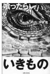
喰ったらやバいきもの 平坂晃 著