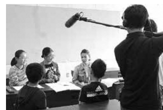
音楽の授業の様子