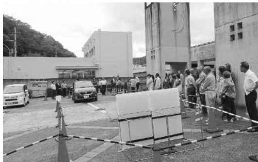
自動ブレーキの体験