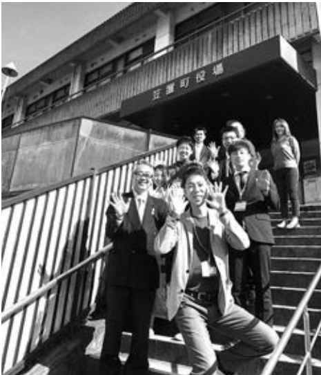
就任当日、総務財政課メンバーでとった思い出の写真です