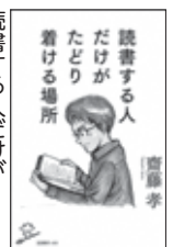
読書する人だけがたどり着ける場所 齋藤 孝著