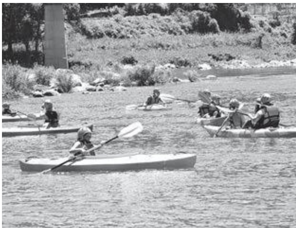
人気のカヌー体験 (過去のイベントの様子)