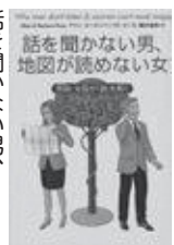
話を聞かない男、地図が読めない女 アンソニー・バロウ著