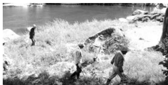
笠置町木津川河川敷

5月26日(日)、木津川漁業協同組合・木津川を美しくする会による「木津川一斉清掃」がおこなわれ、一般の方も多数参加し参加者一同、熱心にゴミ拾いに取り組みました。 見慣れた風景であってもゴミが落ちていたり草が生い茂っていたりするなど、清掃活動を通して木津川の景観に対する意識を新たにすることができました。