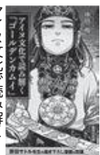
アイヌ文化で読み解くヨールデン・カムイ 中川 裕著