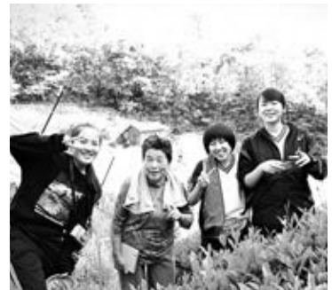
お茶摘みして、晩ご飯のつぐらに