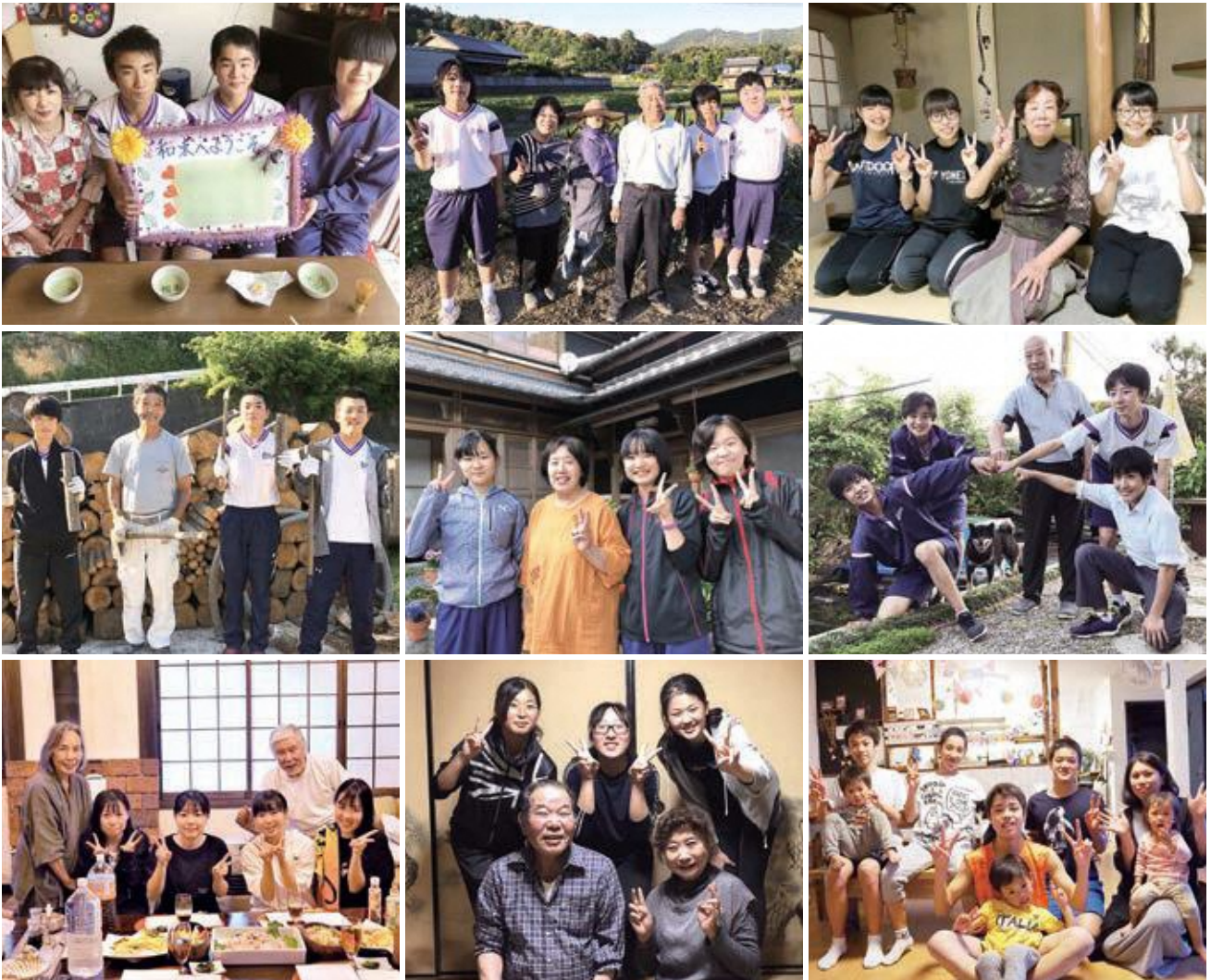
表紙写真：農村宿泊体験受入家庭での様子 (※記事等詳細は5ページを参照)