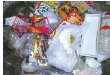
プラスチック容器包装ごみに混ざっていた紙類・ペットボトル類