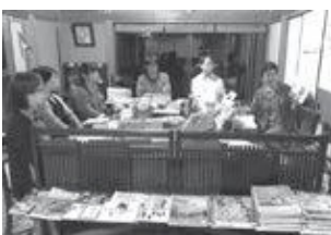
ブックカフェの様子

また、参加者の本の紹介では「そんな本あるんや〜!」といった盛り上がりなどもあり、好奇心がくすぐられる楽しい時間となりました。