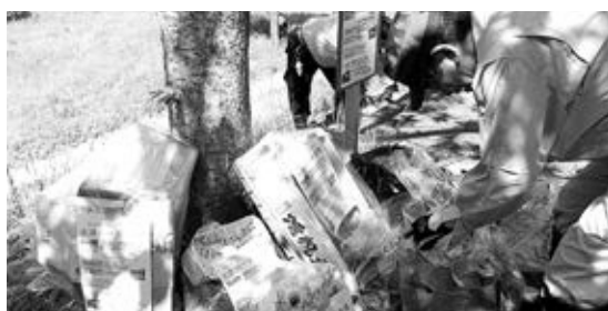
南山城村やまなみホール下河川敷から出たゴミ