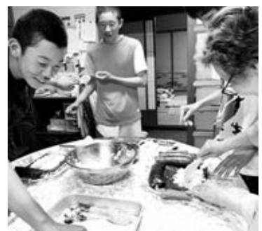
いっしょにお料理を