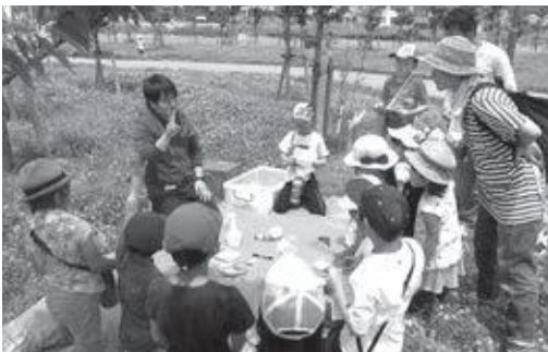
城山台公園でウォークラリー

公園では3町村の児童の交流を目的に、ウォークラリーをおこないました。ミッション指示書にしたがって、5つのチェックポイントで、チームで協力してミッションを遂行しました。各ミッションの合計得点を競い合いながら楽しむことができました。また、お昼はみんなで弁当を食べ、その後はサッカーやドッチビーなどで遊んで楽しく過ごしました。教育委員会生涯学習課では、3町村の子どもたちが積極的に交流できるよう、さまざまな事業を計画しています。ぜひ、親子でご参加ください。