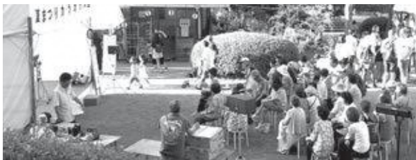
和束夏まつり (昨年の様子)