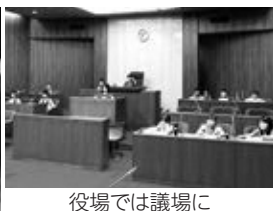
役場では議場に座らせてもらいました

3年生は社会科「わたしたちの住んでいるところ」の学習で、村の道路や建物の様子を調べ、地図記号などを使った「村マップ」作りをするため、6月5日(水)、役場で村の人口や土地利用の様子についてインタビューしました。 いずれの学年も、役場の他にやまなみホール、郵便局、直売所を訪れ、施設の中も見学し仕事内容を説明してもらいました。