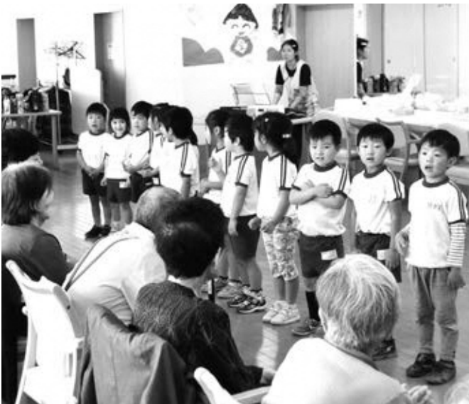
わらくの方々と一緒に歌う子どもたち

その後、風船でバレーボールをしました。子どもたちも大はしゃぎで、わらくの方々も「がんばれ！」と応援したりお互いに楽しい時間を過ごしました。おみやげにバルーンアートをもらい大切に持って帰りました。