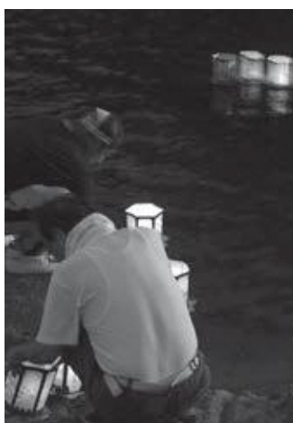
笠置灯ろう流し (昨年の様子)