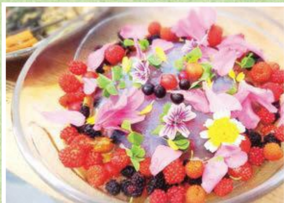
花と野いちごのゼリー

問合せ 移住交流スペース「やまんなか」 (南山城村大字田山小学上フケ10-4) 開館日時:水・金・土曜日 午前10時～午後4時 ☎0743・94・0666