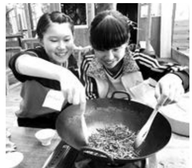
フライパンでほうじ茶づくり