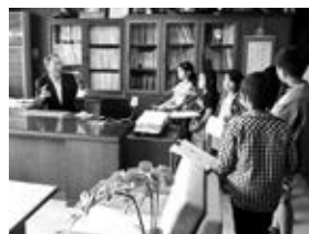
村長にもたくさん質問しました

探検の後には、発見したことや教えてもらったことをもとに「大河原クイズ」を考えました。