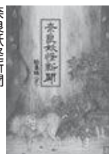
奈良妖怪新聞 木下昌美著