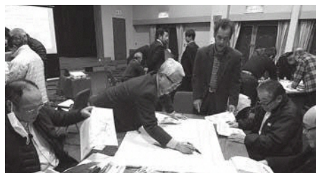
和束町グループでワークショップ