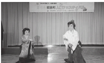
「ファミリー劇団さむらい」さんによる歌謡舞踏ショー

リー劇団さむらい」さんをお招きし、歌謡舞踏ショー、「一睨の母」を講演いただき参加されたみなさんは、大変感動されていました。当日は天候にも恵まれ屋外の模擬店には、多くの来場者が列を作り家族連れで賑わいました。