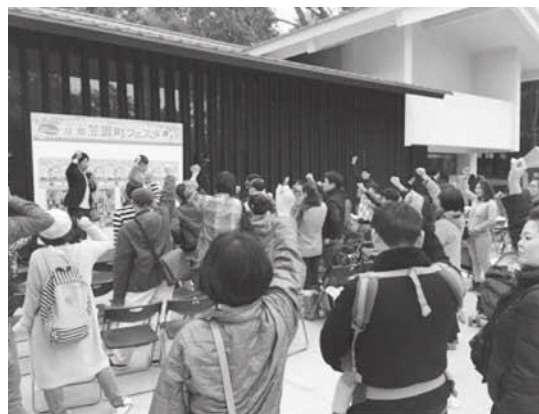
笠やんグッズ争奪じゃんけん大会の様子

自遊宿料理旅館松本亭と春日大社の2会場から、魅力を発信するために『ならどっとFM』のラジオで笠置町と奈良市のお国自慢大会を中継しました。また来場者には笠置名物のきじ鍋(協力:ナカムラポーター株式会社)が数量限定で振る舞われ、春日大社の会場ではじゃんけん大会をおこない、笠置町観光大使の笠やんグッズが争奪戦となりました。