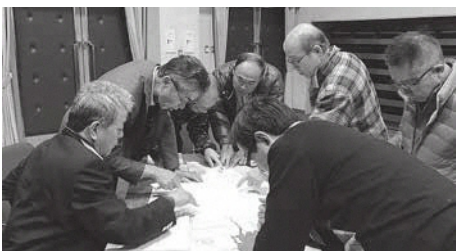
南山城村グループでワークショップ

3月9日(木) 笠置町産業振興会館で3町村それぞれの地区の自主防災組織や、消防団の関係者や自治会の代表者など25人が地域防災リーダー養成講座に参加しました。この講座は各地域において、住民自らが迅速で適切な避難行動を起こせるなど、地域の災害対応力を強化することを目標としておこなわれたもので、参加者は地域の防災・減災対策や避難の判断に関することなど講習を受けた後、地図を用いて要支援者避難計画の作成に取り組みました。災害時に最も早く災害対策に対応できるのはそこに住んでいる自分自身です。各地域にとって最適な対策は地域によって違いますので、既に配布の洪水・土砂災害ハザードマップや地震ハザードマップ、京都府マルチハザード情報提供システム等を利用して各地域、各自において安全に避難できる避難経路や非常持出品、備蓄品の備えについて今一度確認をお願いいたします。