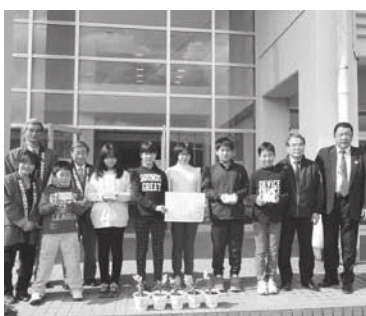
和束小学校の贈呈式の様子