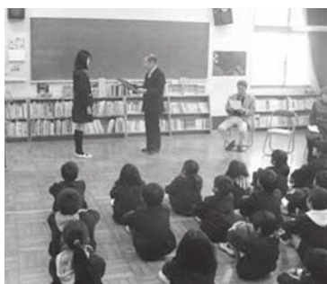
笠置小学校の贈呈式の様子