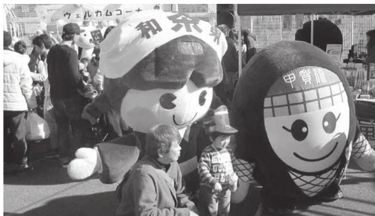
記念撮影をする茶茶ちゃん

茶茶ちゃんは、じゃんけん大会に参加するなど約800人を前に和束町をPRしました。