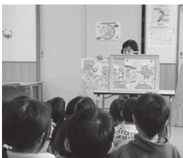
南山城保育園の学びの様子