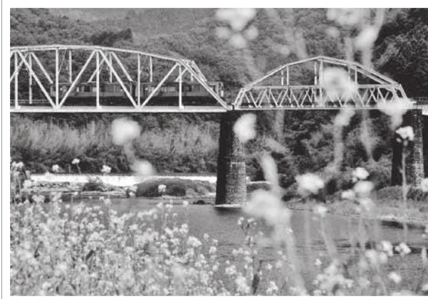
最優秀賞 「春を駆ける」

表彰式は4月9日(日)の「笠置さくらまつり」内でおこないます。また、応募作品は産業振興会館にて4月1日(土)～29日(土・祝)まで展示しておりますので、ご覧ください。