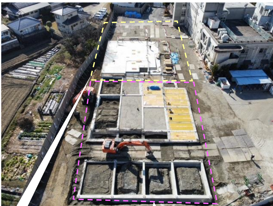
西工区 施工状況(1階床スラブ)

2月末からの鉄骨建て方及びコンクリート躯体工事に向け、施工品質の管理に努めています。