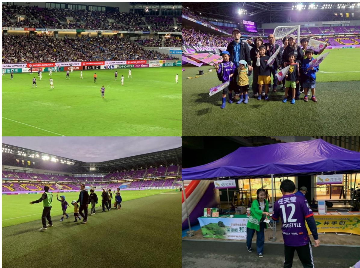
表紙：京都サンガF.C.ホームタウンデー